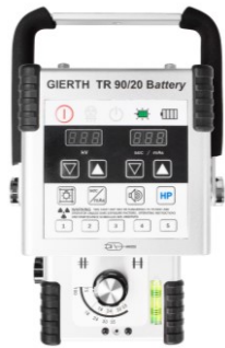
GIERTH TR90/20 Battery Batteriebetriebenes Hochfrequenz-Röntengerät