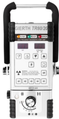
GIERTH TR80/20 Hochfrequenz-Röntengerät Einsteigermodell