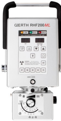
GIERTH RHF200ML Das universelle Resonanz-Hochfrequenz-Röntengerät für den Tierarzt