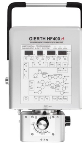
GIERTH HF400A Das Kraftpaket unter den portablen Hochfrequenz-Röntengeräten mit Anatomieprogramm