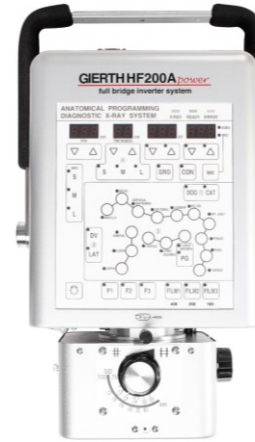
GIERTH HF200power Das Hochfrequenz-Röntengerät mit Anatomieprogramm