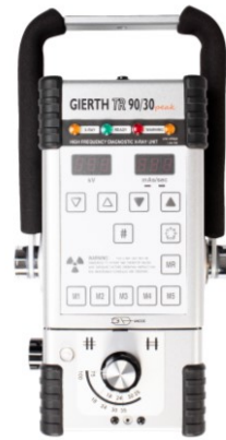
GIERTH TR90/30peak Der Leistungsstärkste im Kleinformat