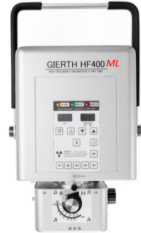
GIERTH HF400ML Das Kraftpaket unter den portablen Hochfrequenz-Röntengeräten